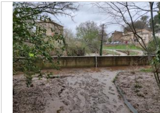
Mur de rive