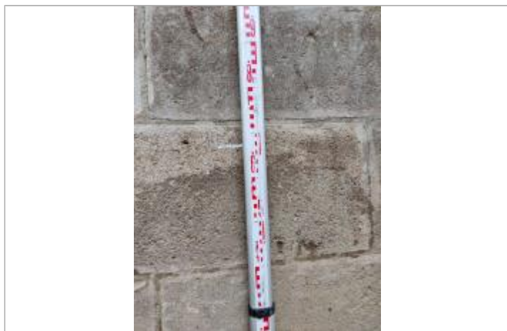
Trace sur la culée RD

Altitude calculée de l'eau (en m) : 12.56 m