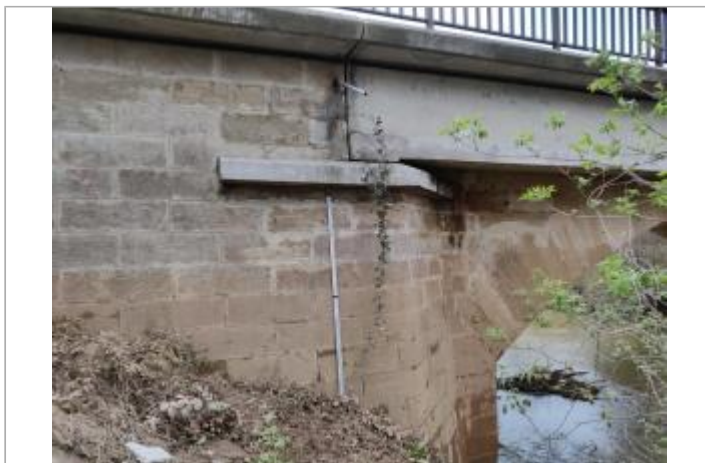
Culée de pont