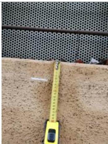
Trace sur le mur

Altitude calculée de l'eau (en m) : 12.49 m