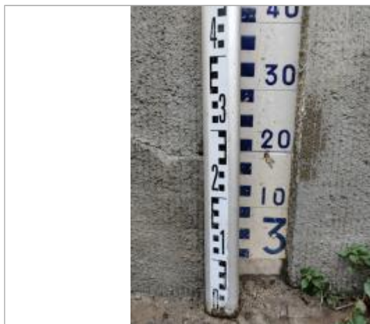
Trace sur l'échelle

Altitude calculée de l'eau (en m) : 12.496 m