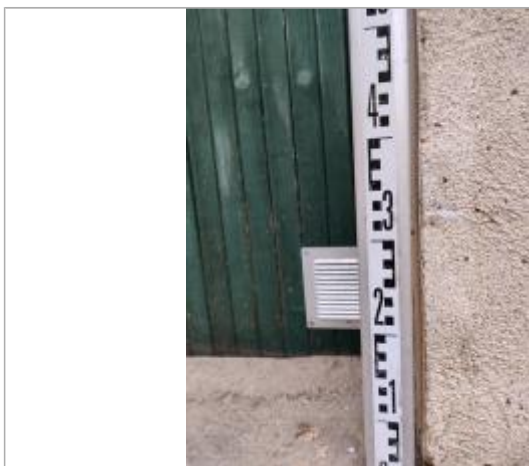
Trace sur le mur