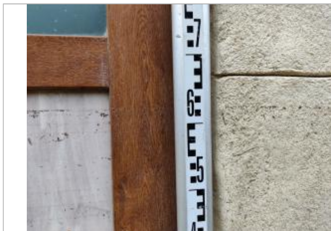
Trace sur la porte

Altitude calculée de l'eau (en m) : 12.452 m