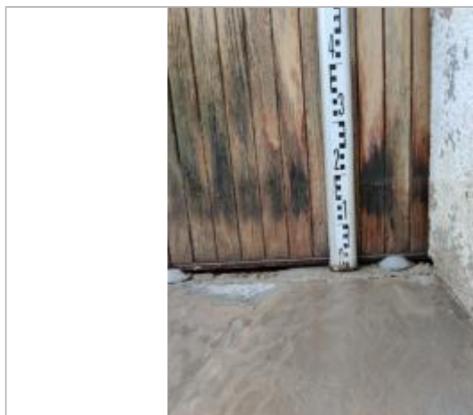
Trace sur le portail