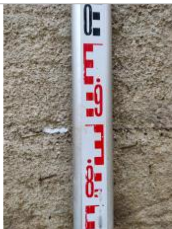
Trace sur la culée