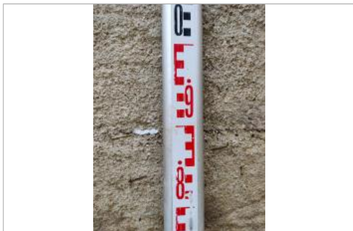
Trace sur la culée

Altitude calculée de l'eau (en m) : 12.442 m