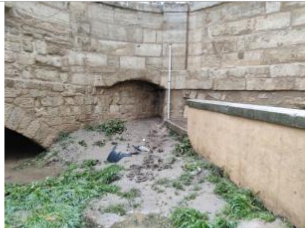
Culée du pont