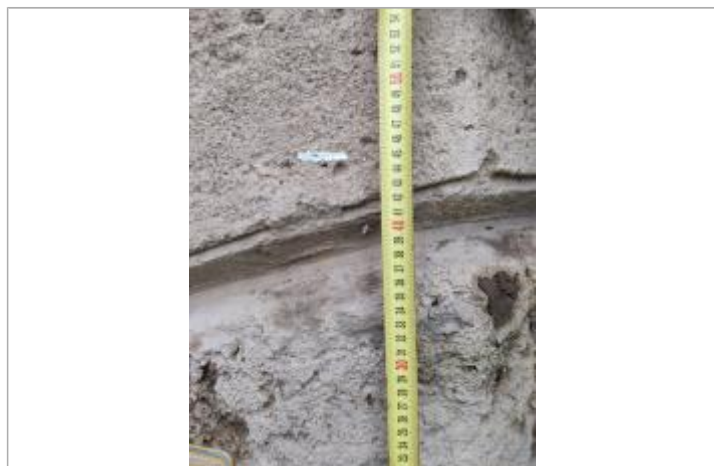
Trace sur l'arche

Altitude calculée de l'eau (en m) : 12.355 m