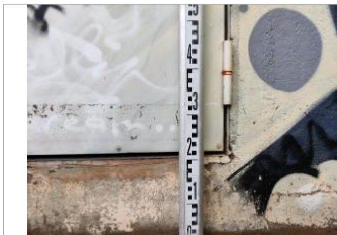
Trace sur la porte