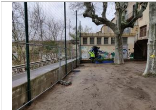
Porte métallique transformateur