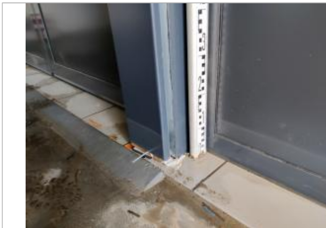
Trace sur la vitre