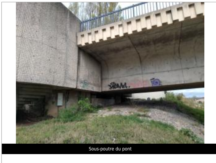
Sous-poutre du pont