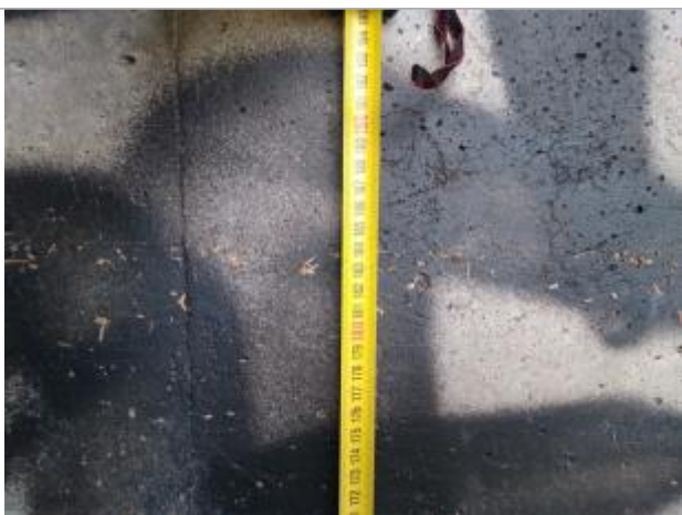
Trace sur le sous-poutre

Altitude calculée de l'eau (en m) : 12.2 m