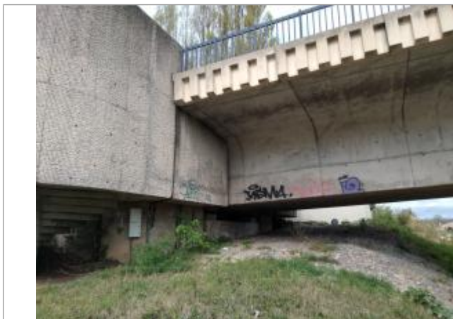
Sous-poutre du pont

Coordonnées WGS84 : X: 3.21161080 / Y: 43.33477640