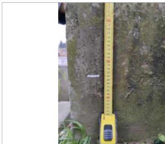
Trace sur le muret