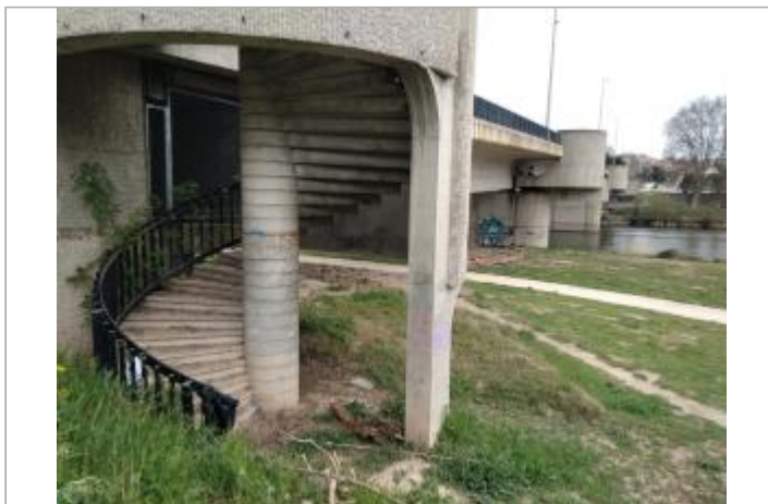
Axe de l'escalier