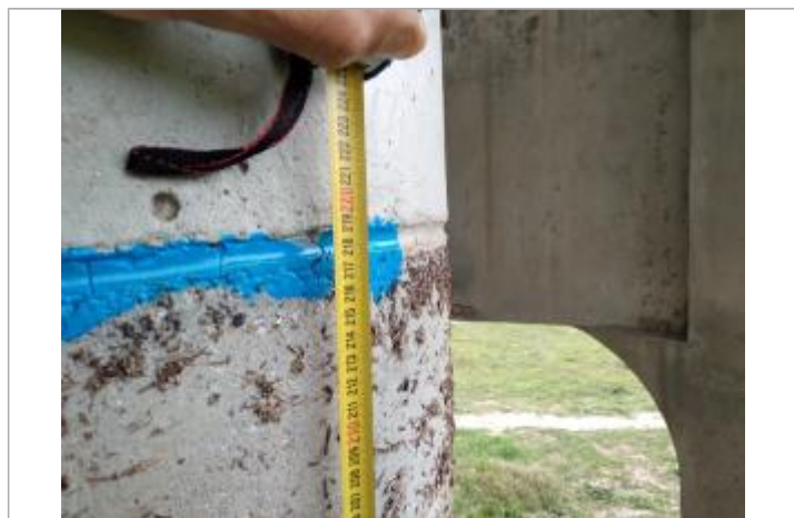
Trace sur l'axe de l'escalier

Altitude calculée de l'eau (en m) : 12.164 m