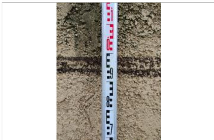
Trace sur le mur

Altitude calculée de l'eau (en m) : 12.2 m