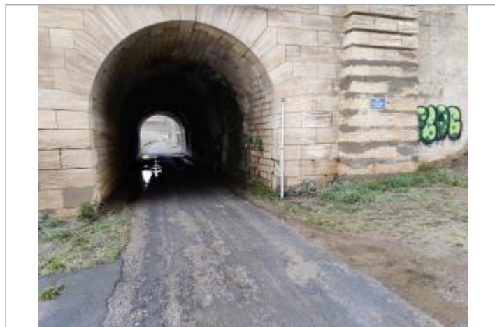
Arche du pont

GÉOLOCALISATION Coordonnées WGS84 : X: 3.21364380 / Y: 43.33497930 Coordonnées RGF93 (Lambert 93) X: 717335.5 / Y: 6248449 Coordonnées RGF93 (ETRS89) : X: 3.2136438 / Y: 43.3349793 Code Hydro: Y25-0400 Rive de référence: Gauche