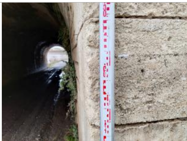
Trace sur l'arche

Altitude calculée de l'eau (en m) : 12.14 m