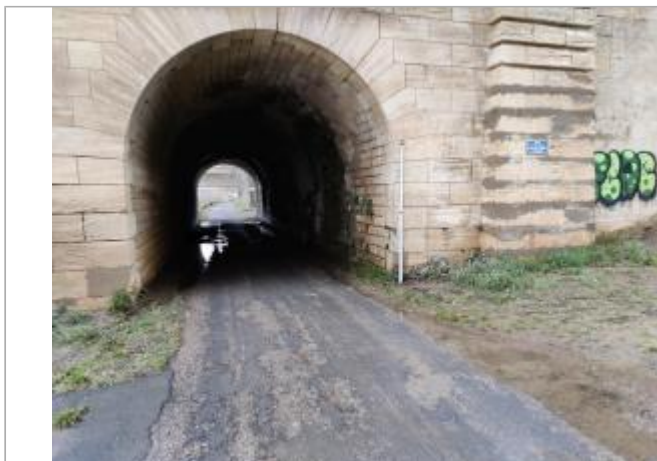
Arche du pont

Coordonnées WGS84 : X: 3.21364380 / Y: 43.33497930