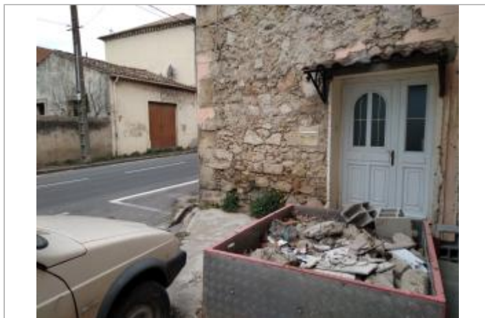
Cadre de porte