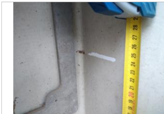
Trace dans le tableau

Altitude calculée de l'eau (en m) : 12.069 m