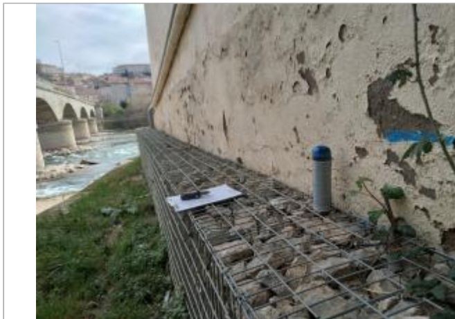
Mur de maison