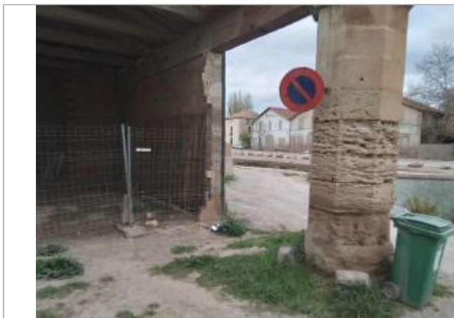
Mur du préau