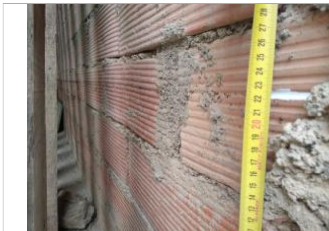
Trace sur le mur