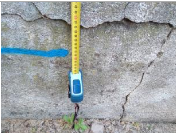
Trace sur le mur

Altitude calculée de l'eau (en m) : 11.847 m