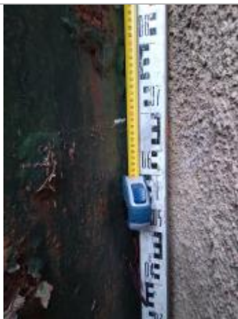
Trace sur le portail