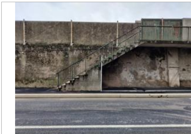
Escaliers d'accès aux tribunes

Coordonnées WGS84 : X: 3.22487220 / Y: 43.33212280