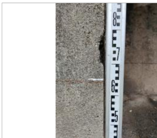
Trace sur les escaliers