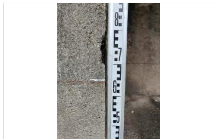
Trace sur les escaliers

GÉNÉRAL Code : 23_ORB22_R_261_1 Date de mise à jour : 26/04/2023 Auteur : SPC MO