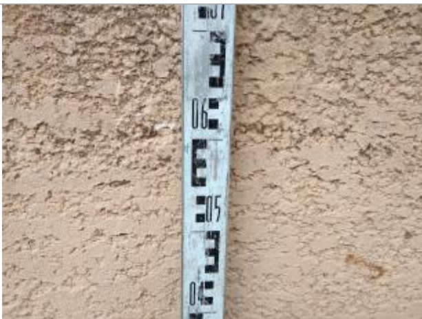
Trace sur le muret

Altitude calculée de l'eau (en m) : 11.21 m