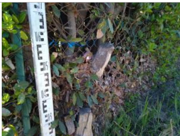
Dépôt dans la haie