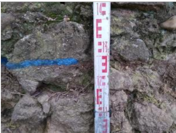
Trace sur le mur

Altitude calculée de l'eau (en m) : 10.31 m