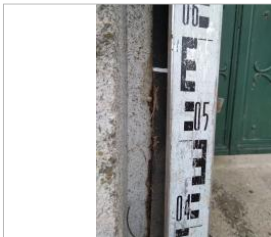
Trace sur le joint du portail