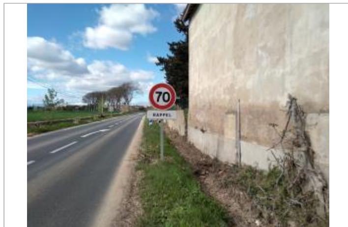
Mur de maison

GÉOLOCALISATION Coordonnées WGS84 : X: 3.22738890 / Y: 43.31875870 Coordonnées RGF93 (Lambert 93) X: 718456 / Y: 6246649 Coordonnées RGF93 (ETRS89) : X: 3.2273889 / Y: 43.3187587 Code Hydro: Y25-0400 Rive de référence: Droite