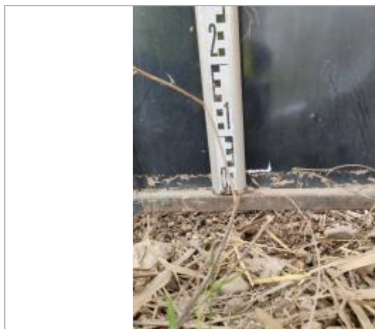
Trace sur le portail