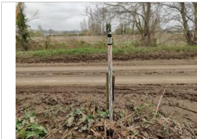
Poteau en bois