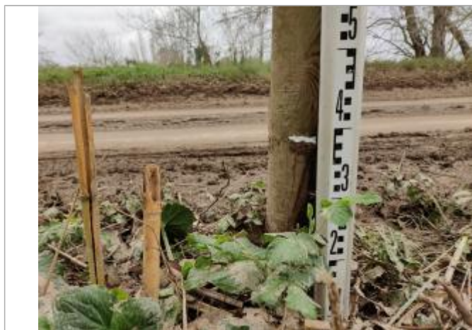
Trace sur le poteau