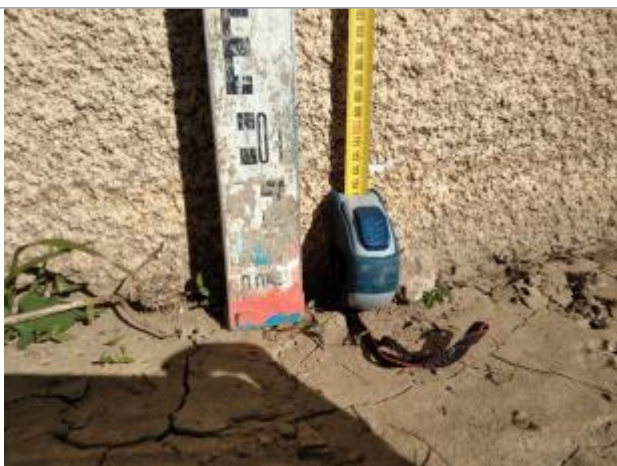
Trace sur le mur

Altitude calculée de l'eau (en m) : 8.268 m