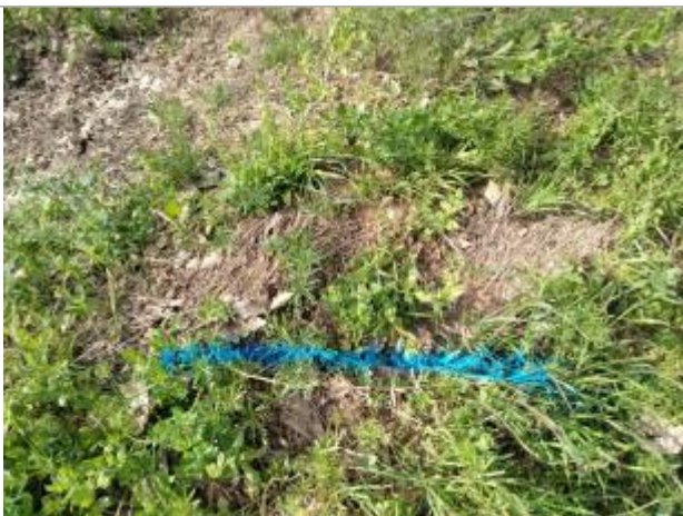
Dépôt contre le talus

Altitude calculée de l'eau (en m) : 8.08 m