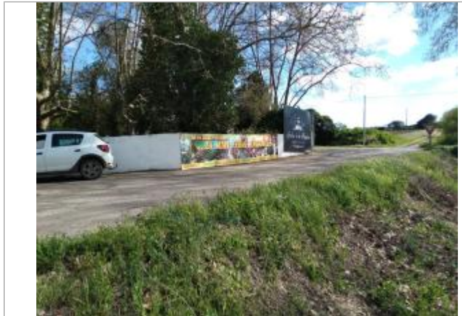
Talus de route