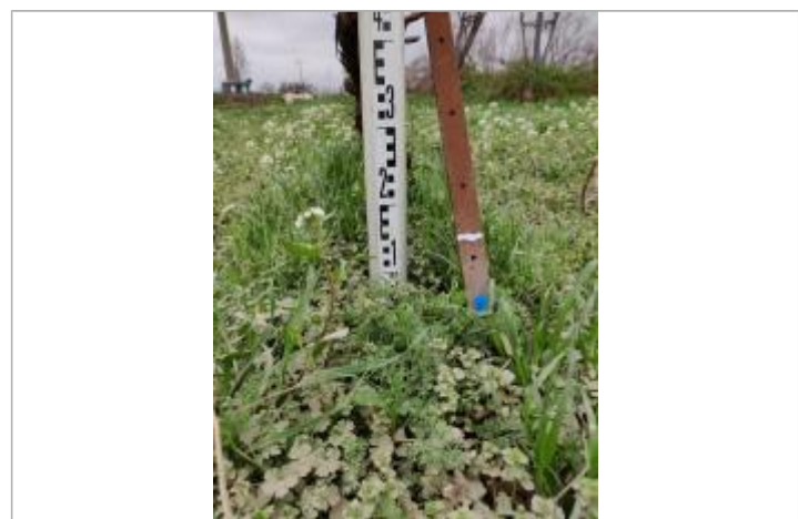
Trace sur le piquet

GÉNÉRAL Code : 23_ORB22_R_214_1 Date de mise à jour : 26/04/2023 Auteur : SPC MO