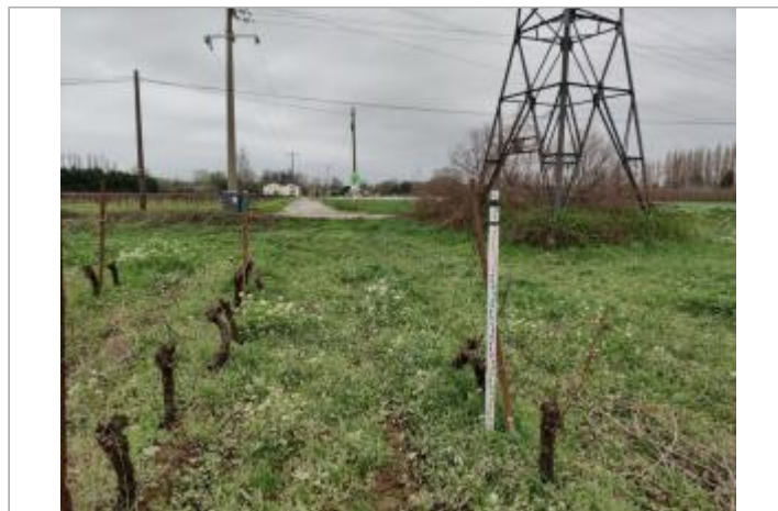
Piquet de tête

GÉOLOCALISATION Coordonnées WGS84 : X: 3.24032320 / Y: 43.32143850 Coordonnées RGF93 (Lambert 93) X: 719504.9 / Y: 6246950 Coordonnées RGF93 (ETRS89) : X: 3.2403232 / Y: 43.3214385 Code Hydro: Y25-0400 Rive de référence: Gauche