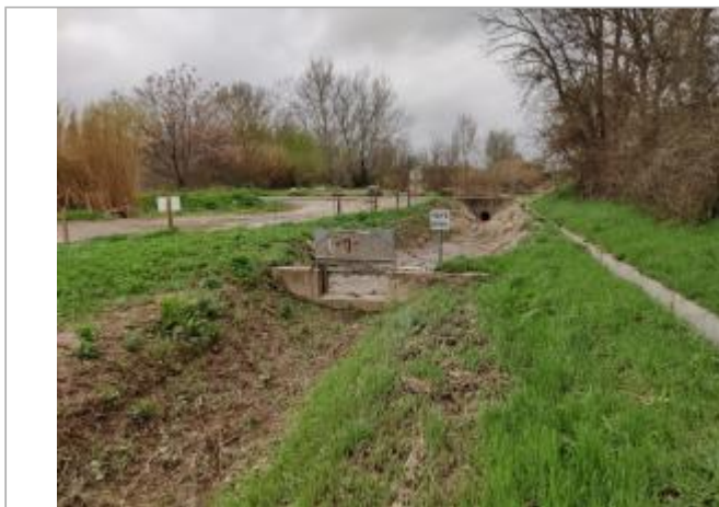
Martelière assainissement pluvial

Coordonnées WGS84 : X: 3.25447970 / Y: 43.31237430