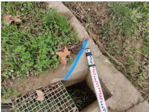
Dépôt sur le haut de l'ouvrage

Altitude calculée de l'eau (en m) : 7.523 m