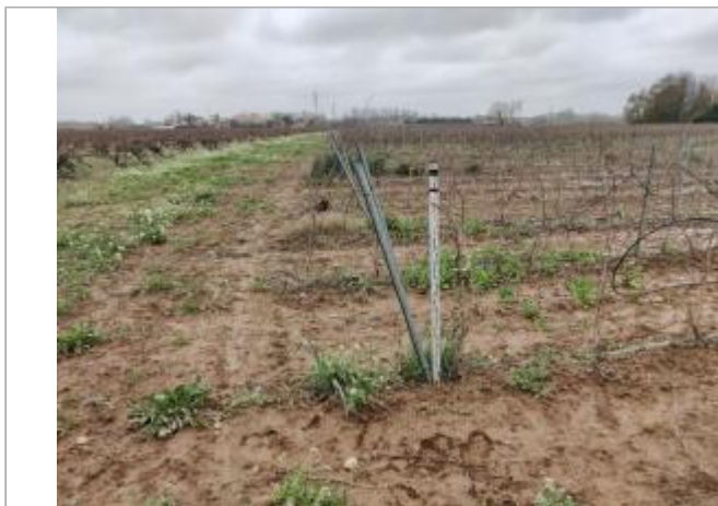
Piquet de tête de la vigne