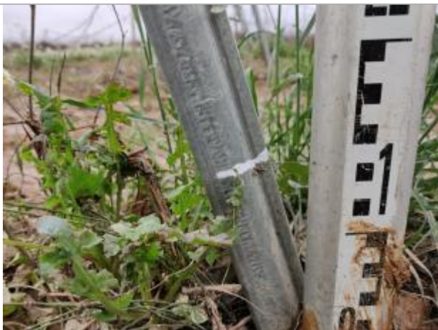
Trace sur le piquet

Altitude calculée de l'eau (en m) : 7.32 m