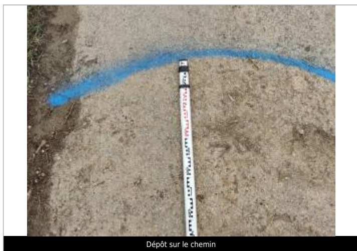
Dépôt sur le chemin

Altitude calculée de l'eau (en m) : 6.924 m