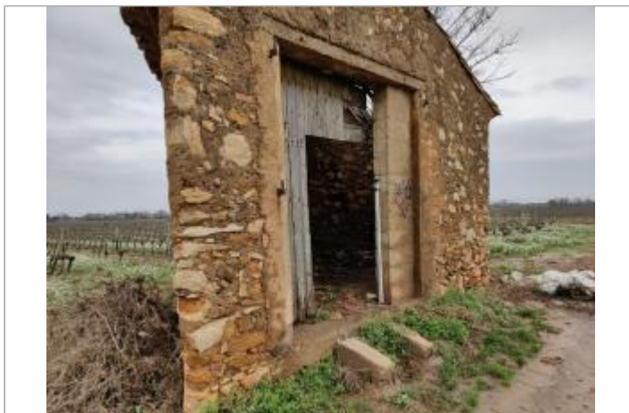
Mur du Mazet