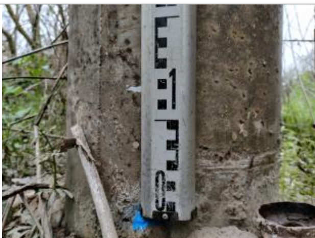
Trace sur le poteau