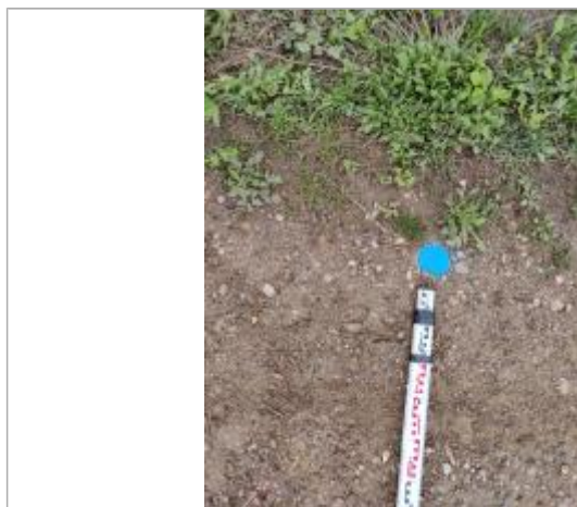
Dépôt sur le chemin