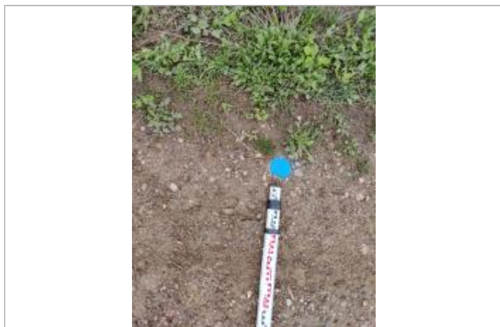
Dépôt sur le chemin