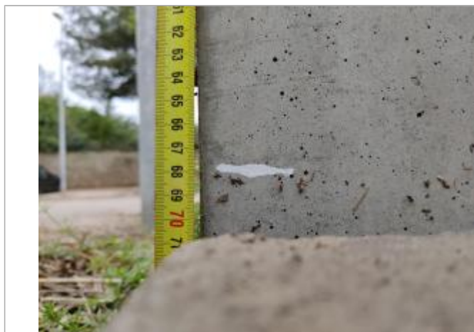
Trace sur le tableau