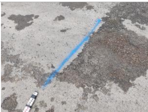
Dépôt sur le chemin