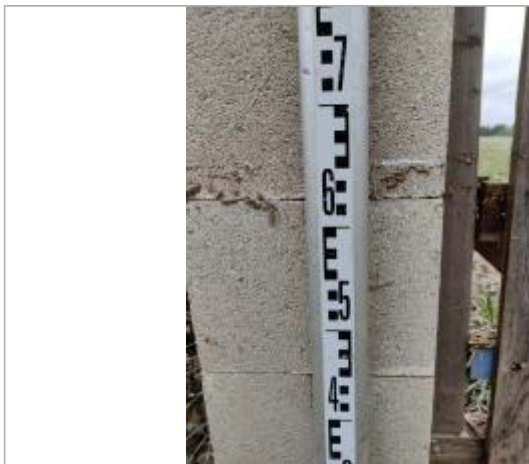
Trace sur le montant béton

Altitude calculée de l'eau (en m) : 6.395 m