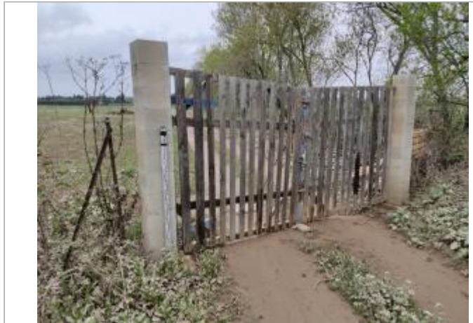
Montant de portail

Coordonnées WGS84 : X: 3.27235500 / Y: 43.31472360