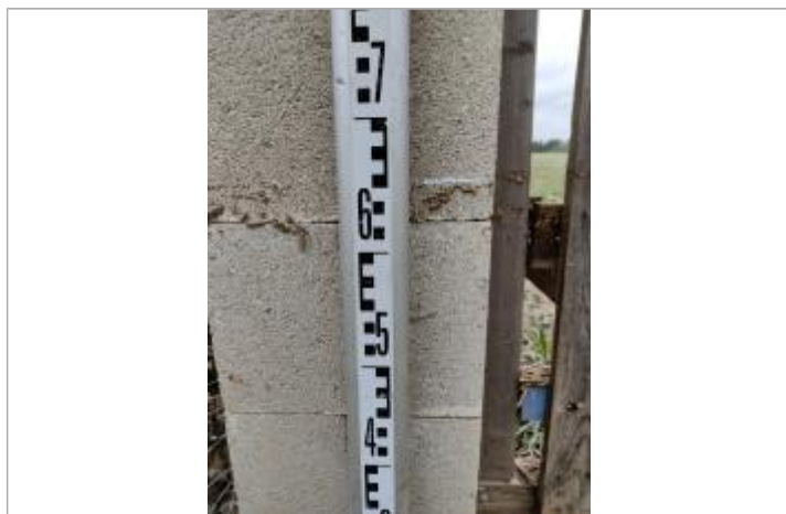
Trace sur le montant béton