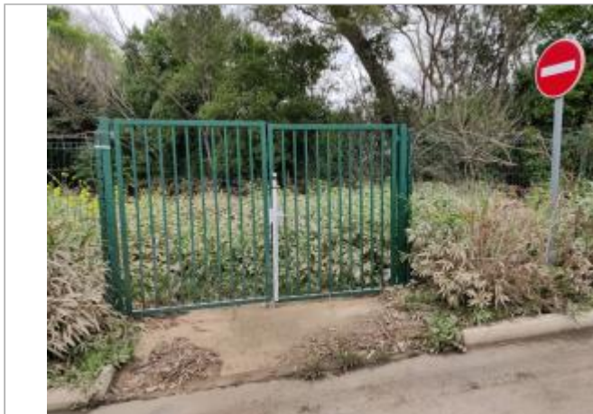
Portail au fond du parking

Coordonnées WGS84 : X: 3.26410100 / Y: 43.29406290