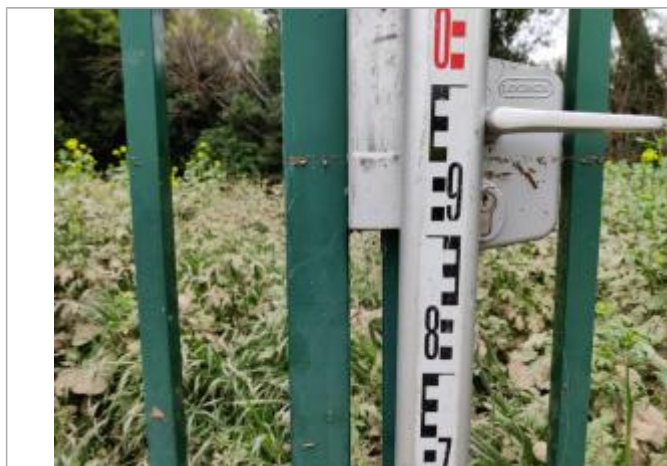
Trace sur le portail

Altitude calculée de l'eau (en m) : 6.322 m