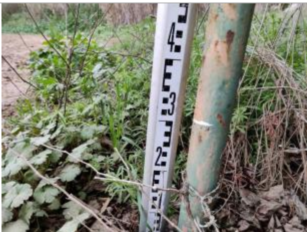
Trace sur le poteau