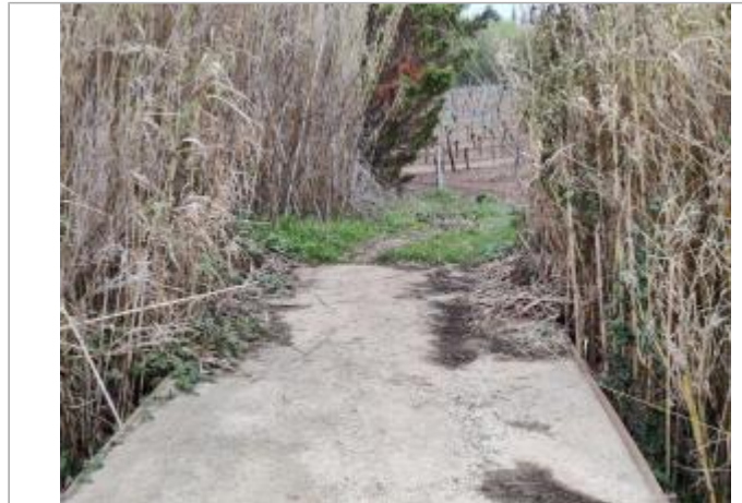
Piquet de Clôture

Coordonnées WGS84 : X: 3.26643670 / Y: 43.31902040