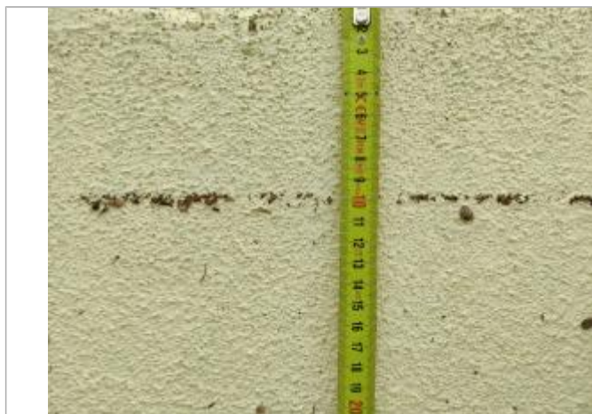
Trace sur le mur

Altitude calculée de l'eau (en m) : 6.223 m