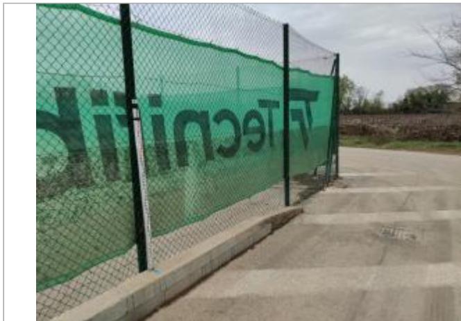
Clôture du cours