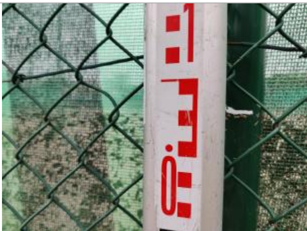
Trace sur le piquet

Altitude calculée de l'eau (en m) : 6.292 m