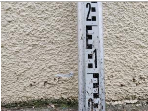
Trace sur le mur

Altitude calculée de l'eau (en m) : 6.24 m