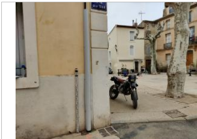
Mur du bâtiment