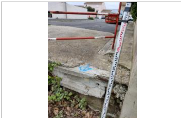
Poutre béton de soutènement