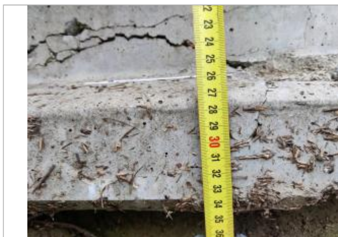
Trace sur la poutre

Altitude calculée de l'eau (en m) : 6.135 m