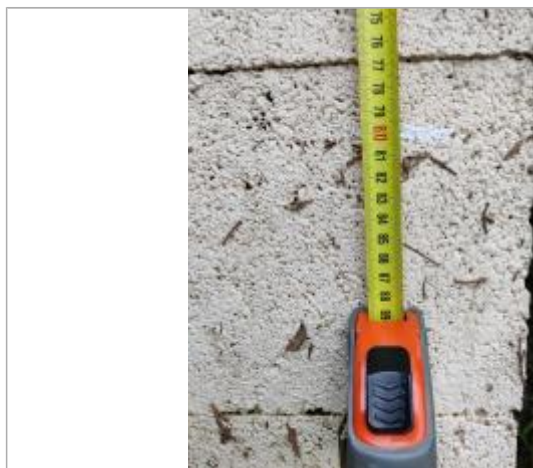
Trace sur le montant