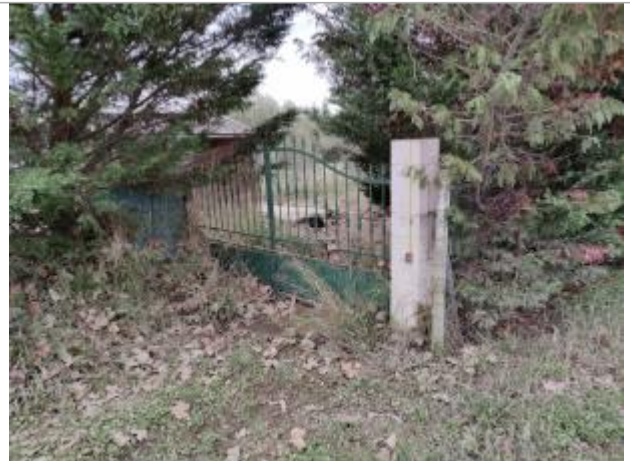
Montant de portail

Coordonnées WGS84 : X: 3.26914010 / Y: 43.29030830