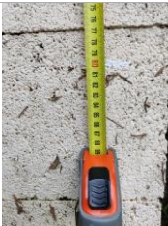
Trace sur le montant