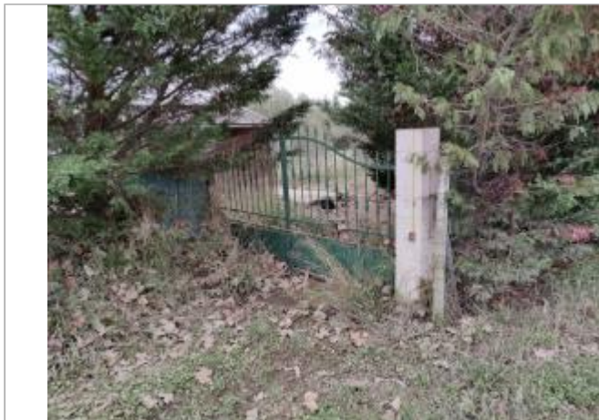
Montant de portail